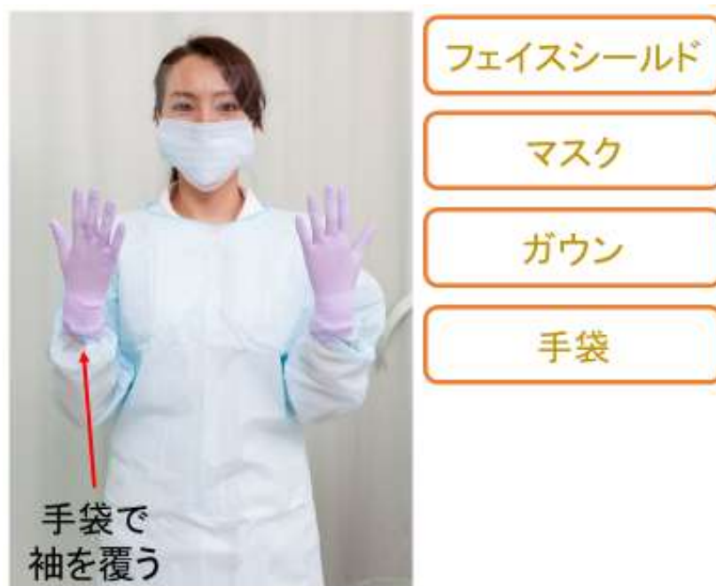
図 1 個人防護具(PPE)着用例