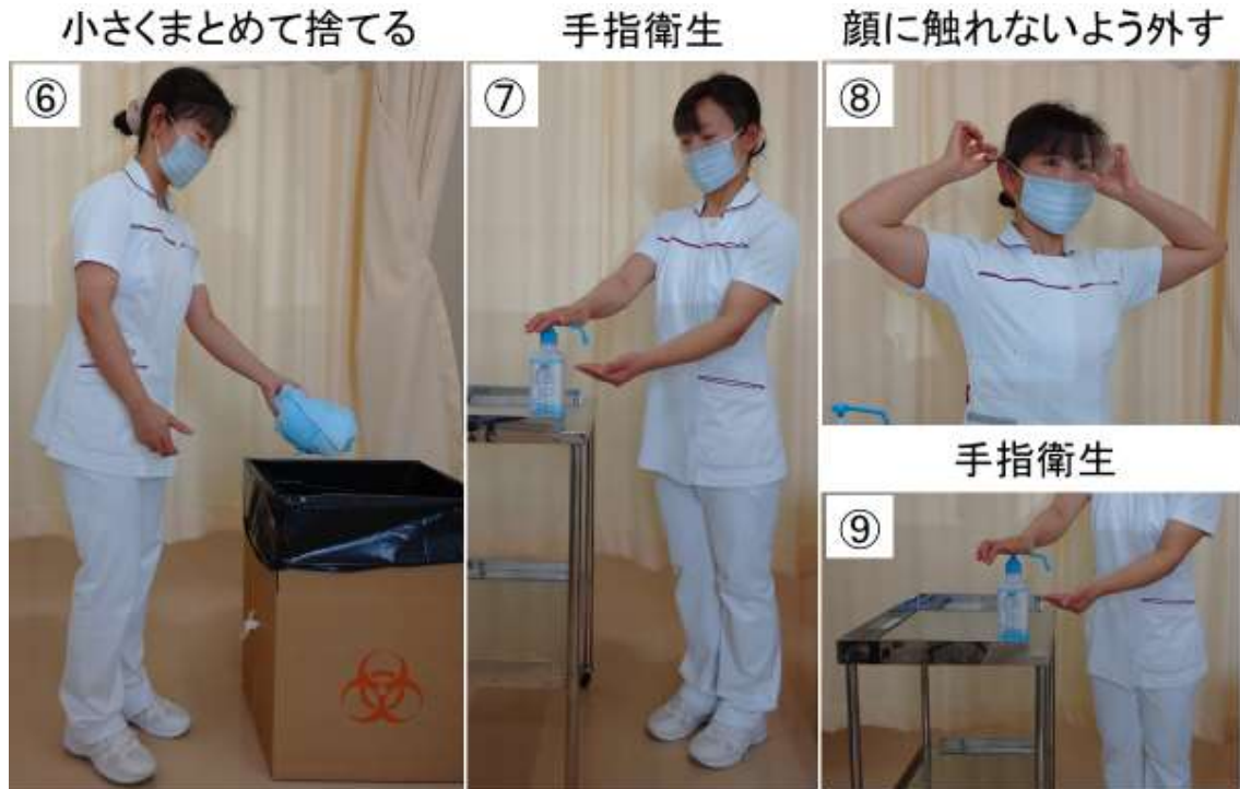
図 5 個人防護具(PPE)の脱ぎ方